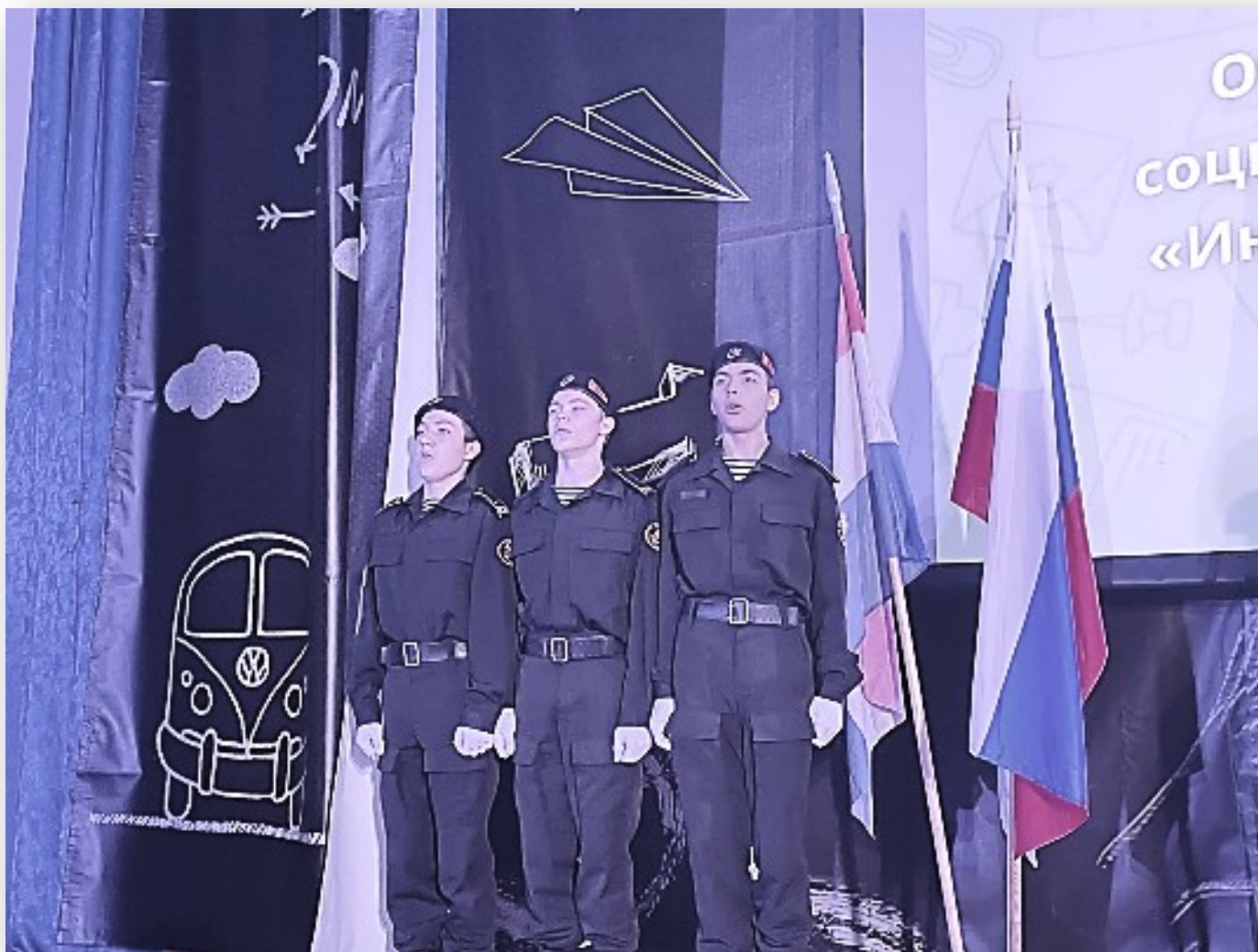
Церемония подъема (спуска) Государственного флага Российской Федерации и исполнение Государственного гимна Российской Федерации